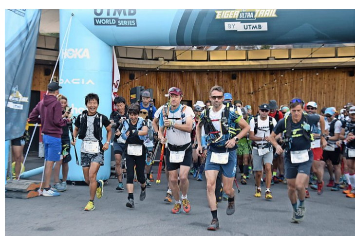
Wer 250 Kilometer und 20'000 Höhenmeter unter die Füsse nimmt, muss am Start nicht unbedingt zuvorderst sein.

Die Orte, wo es Verpflegung gibt beziehungsweise eine sogenannte Lifebasis, tönen wie Wanderziele: Stechelberg, Kandersteg, Jeizinen, Belalp, Bellwald, Grimselpass und Geissholz. Lokale