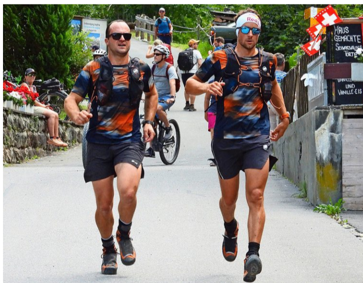
Nach 13:08 Stunden erreichen die beiden Freunde Stechelberg.